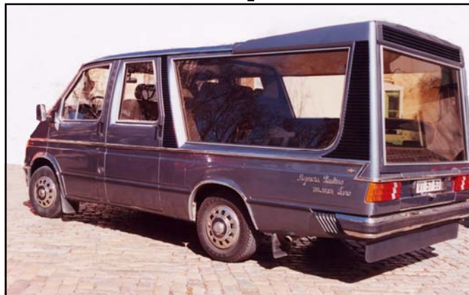
Este trabalhador estava esperando pelos exames médicos e o giro dele agora está em dobra!

No centro clínico dos CTT no Largo do Carmo em Faro, funciona a Direcção de Saúde no Trabalho (DST) antes designada por (SSO), a empresa Correios do Algarve que deveria cumprir com a legislação em vigor, efectuando exames médicos