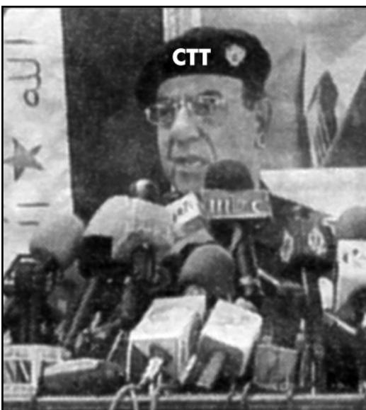
Ministro da Informação dos Correios

muitas dezenas de estações em todo o País e na distribuição, se os trabalhadores cumprirem com o pré aviso ao trabalho extraordinário, nem tão cedo normalizará a entrega do correio acumulado